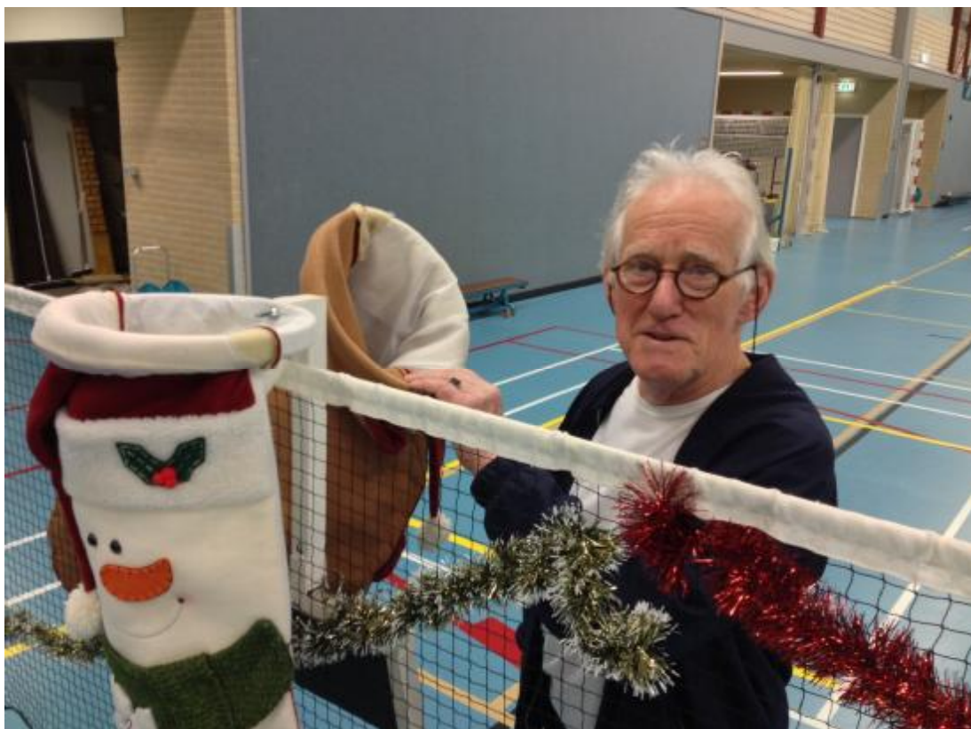
Harm in actie met het ophangen van de Kerstsokken

Aan het einde van de avond werden de Kerstsokken uitgereikt aan de winnaars van het Kersttoernooi.